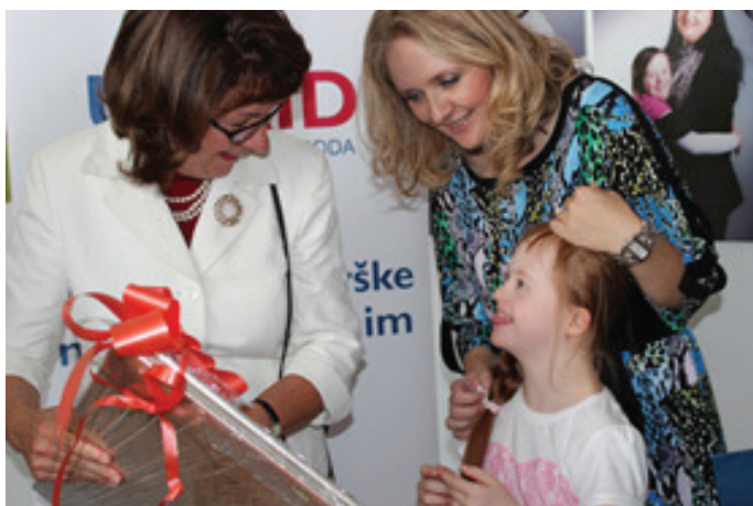
Maureen Cormack, ambasadorica Sjedinjenih Američkih država u BiH na otvaranju Servis centra.

19.9.2015. svečano je otvoren banjalučki Servisni centar „Dajte nam šansu“ čije će aktivnosti provoditi Dječiji edukativni centar „Svjetlice“ nakon ranije potpisanog ugovora o dodjeli granta između Američke agencije za međunarodnu saradnju (USAID) i Udruženja porodica djece i osoba s poteškoćama u razvoju „Dajte nam šansu“ iz Sarajeva.