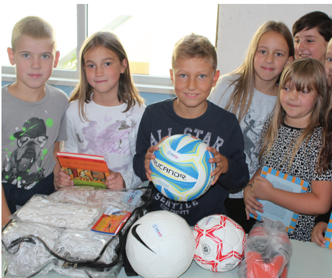
Učenič/e Osnovne škole Glamoč sa opremom za tjelesni odgoj

Navedena oprema je značajno unaprijedila kvalitetu izvođenja nastave u Glamoču za preko 400 učenika/ca osnovne i srednje škole.