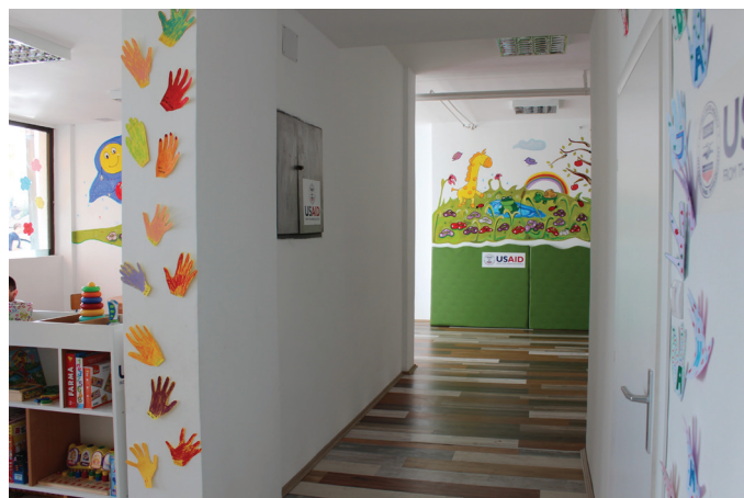
Novootvoreni Servisni centar prije svečanog otvorenja

šansu“ i Željka Perišić – predsjednica Dječijeg centra „Svjetlice“. Podrška američkog naroda preko USAID-a, između ostaloga, ogleda u činjenici da će banjalučki Servisni centar, pored postojećeg Centra u Sarajevu, biti u mogućnosti pružati besplatnu podršku porodicama djece i osoba sa poteškoćama u razvoju neovisno o dobi, vrsti ili stepenu poteškoće svojih korisnika/ca. Neke od usluga su: psihološka potpora, edukacija nastavnog i volonterskog osoblja, te pomoć u kriznim situacijama.