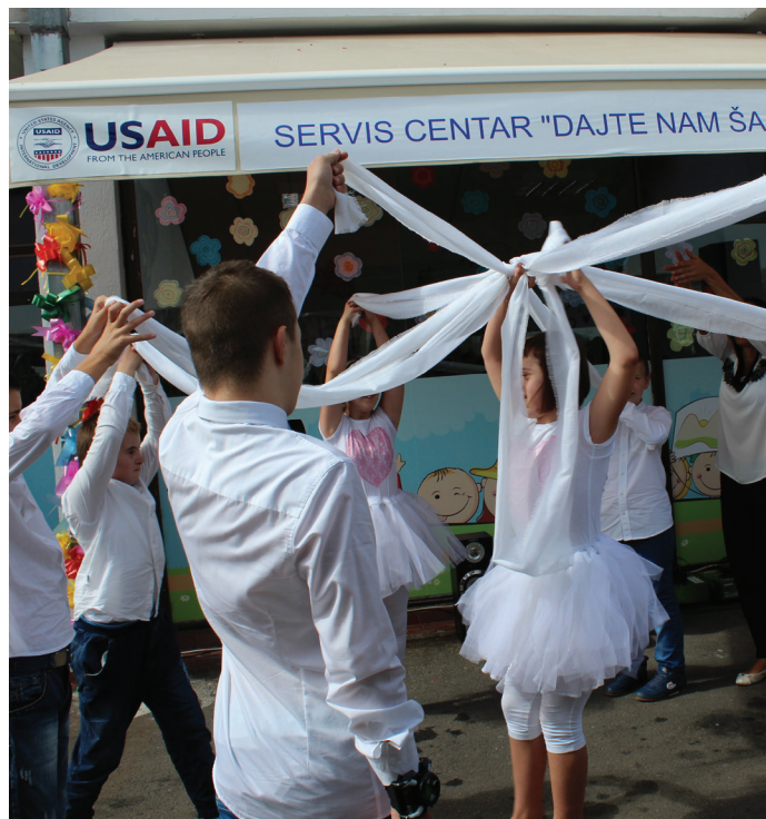
Korisnici/e Centra koji su spremili prigodan performans za svečano otvorenje

Približno trideset hiljada djece sa poteškoćama u razvoju u BiH podršku dobiva isključivo u vlastitoj porodici, nekoj instituciji ili kroz sporadično obrazovanje. Dijete ili osoba sa poteškoćama u razvoju u BiH rijetko ima priliku za obrazovanje, zaposlenje, inkluziju i ravnopravno učešće u društvu. Otvaranjem drugog Servisnog centra „Dajte nam šansu“ u BiH, pored već postojećeg u Sarajevu, ove činjenice postepeno postaju prošlost. Inkluzija nije način na koji se ove osobe uključuju u procese u svojim zajednicama, već način na koji se te zajednice prilagode prvenstveno njima, ali i njihovim porodicama kroz adekvatne programe, podršku, aktivnosti.